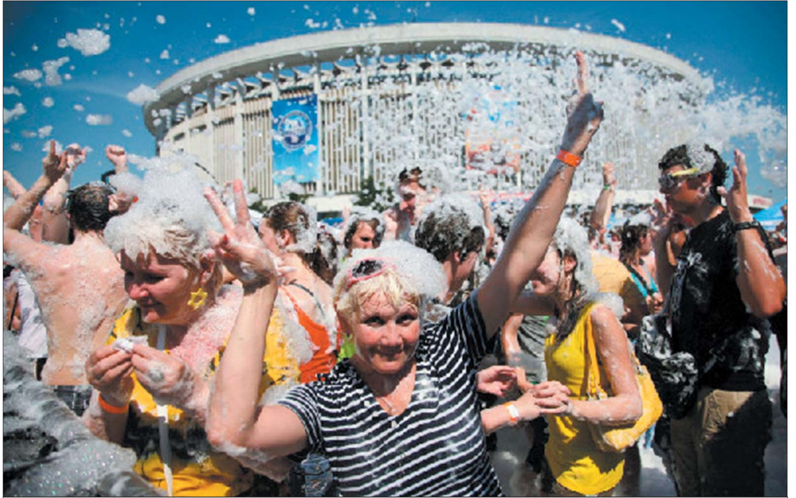
Пивные фестивали в Санкт-Петербурге власть была вынуждена запретить

Закон о распитии спиртных напитков предусматривает ответственность не только за сам факт их распития в общественных местах, но и за появление в состоянии алкогольного опьянения. При этом, как штраф за распитие спиртных напитков в общественных местах, так и штраф за появление в состоянии алкогольного опьянения сопоставимы (в последнем случае его сумма, которую определяет статья 20.21, колеблется от 100 до 500 рублей). Однако во втором случае вме-