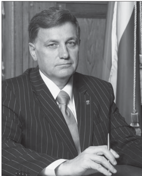
Секретарь Санкт-Петербургского регионального отделения Партии «Единая Россия», Председатель Законодательного Собрания Санкт-Петербурга Вячеслав МАКАРОВ

Пусть в вашей душе всегда будет весна, а счастье, любовь и удача являются вашими постоянными спутниками!