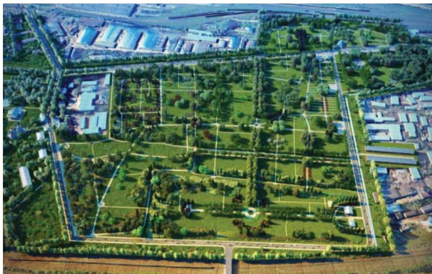
Проект парка на месте бывшего Митрофаньевского кладбища

Для наглядности была создана специальная 3D-модель города. Она дает возможность не только увидеть рельеф и застройку, но и построить поверхность видимости, чтобы высота нового здания не превышала нормативы (базовая высота застройки за пределами исторического центра города будет ограничена 40 метрами). Помимо этого, при определении вы-