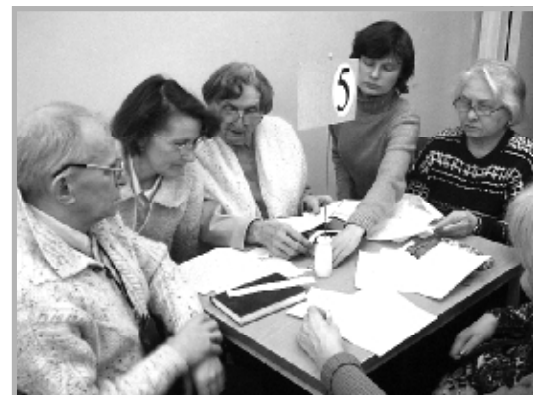
Педсовет по новым педтехнологиям