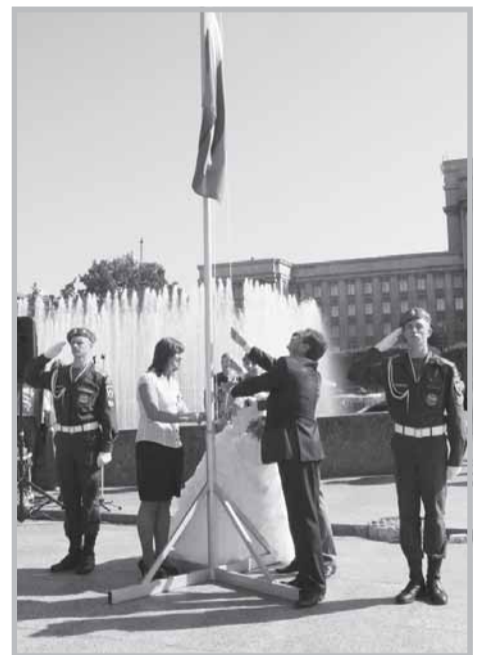
Праздник на Московской площади

Согласно Уголовному кодексу, надругательство над Государственным гербом РФ или Государственным флагом карается ограничением свободы на срок до двух лет, либо арестом на срок от трёх до шести месяцев, либо лишением свободы на срок до одного года.