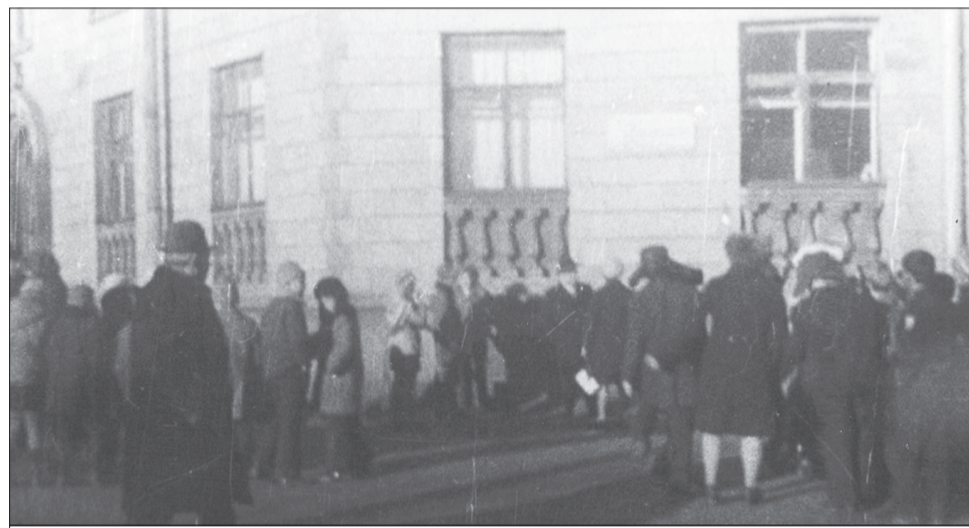
Открытие мемориальной доски А.Ф. Типанову (фотография из архива О.Н. Зайцевой)