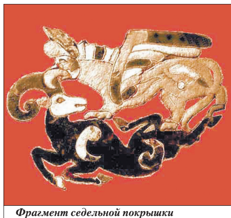
Фрагмент седельной покрывки

Памятники искусства древнего Алтая, обнаруженные в пазырыкских курганах, отличаются красочностью из-за того, что мастера использовали самые различные материалы: золото, олово, серебро, бронзу, дерево, войлок, мех, кожу. В курганах найдено много высокохудожественных, неповторимых произведений искусства, выполненных в особой художественной манере, так называемом сибирском зверином стиле. Горные козлы и бараны, благородные олени, величественные лоси и нападающие на них хищники, а также фантастические существа, например грифоны, – таковы основные образы алтайского искусства скифского времени.