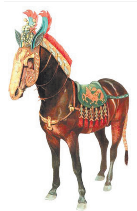
Реконструкция внешнего вида коня из Первого пазырыкского кургана

Впервые в пазырыкских курганах были найдены сохранившиеся трупы убитых лошадей, а не их скелеты, как в других захоронениях; и вместе с ними комплекты седел, уздечек и чепраков. Это были рыже-золотистые, высокорослые стройные кони, вскормленные зерном. Такой вывод сделали специалисты по состоянию шерсти и по характеру стертости зубов. За внешностью коней заботливо следили: гривы и челки у них подстрижены, а хвосты заплетены в косы или завязаны узлами. На ушах всех лошадей оказались надрезы-метки, у всех разные. Это знаки собственности. Кони и все их сна-