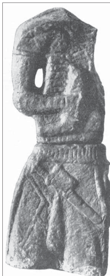
Скульптура, найденная на Кубани

скульптуры. И еще, несмотря на большую поврежденность, видно, что древний скульптор вырубил из камня сильную, мощную, крепкую фигуру воина. Перед нами и представлен сильный вооруженный воин. Он одет в чешуйчатый пластинчатый панцирь, украшенный на плечах и груди головами грифонов. На воине широкий боевой пластинчатый пояс, к которому подвешен меч-акинак в ножнах с рукоятью с брусковидным навершием и лук в горите, в руке секира.