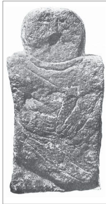
Скульптура, найденная в кургане у станицы Елизаветинской в устье Дона

Другое изваяние найдено на Кубани, хранится в Краснодарском музее, сделано также довольно грубовато, но все же, по сравнению с первой статуей, его поверхность лучше обработана. Можно даже сказать, что здесь, в отличие от Елизаветинской фигуры произошли значительные изменения в изготовлении