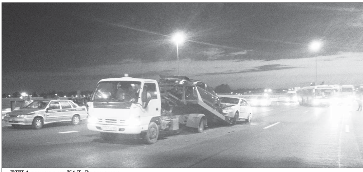
ДТП 1 августа на КАД. Эвакуатор