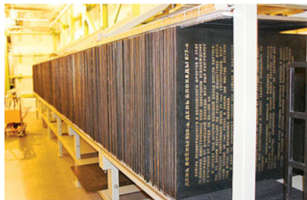
Новое хранилище бронзовых страниц «Летописи героических дней блокады»

Сотрудники музейного комплекса и подрядчики, проводившие реставрацию, гордятся тем, что, несмотря на масштабность выполненных работ, внешний вид монумента не изменился. Сторонний наблюдатель даже и не заметит итогов года труда. Но после этой реставрации Монумент героическим защитникам Ленинграда готов простоять на площади Победы еще долгие десятилетия!