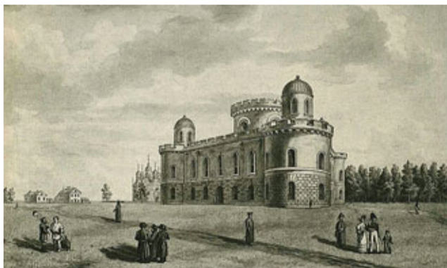
Вид Чесменского дворца. Неизвестный художник. Рисунок пером. Конец XVIII века

Дворец в плане представляет собой равно-сторонний треугольник, углы которого выполнены в виде башен, завершающихся фонарями с полусферическими куполами.