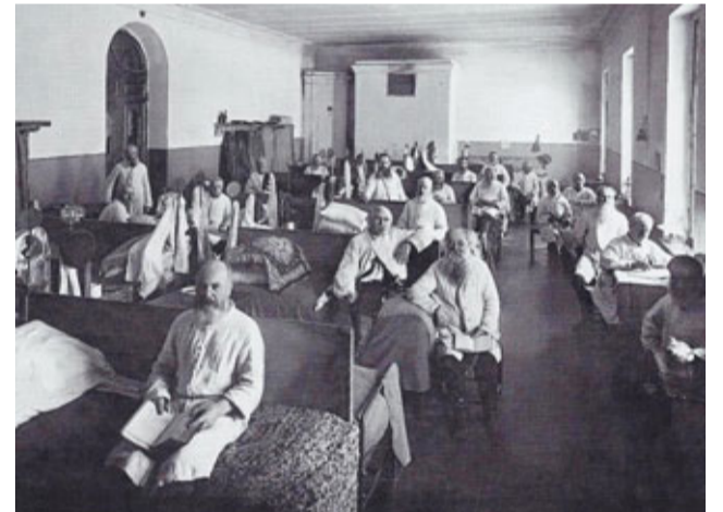
Бывшие воины русской армии, призреваемые в Чесменской богадельне

Богадельня закрылась лишь в 1919 году, после чего в здании был организован первый в советской истории концлагерь — «Чесменка». В 1930-х годах дворец был передан Автодорожному институту, а в 1941-м — Ленинградскому институту авиаприборостроения. В годы Великой Отечественной войны дворец и церковь, находившиеся на передовой, очень пострадали. В 1946 году дворец был отреставрирован (архитектор А.В. Корягин). Во дворце разместились Государственный университет аэрокосми-