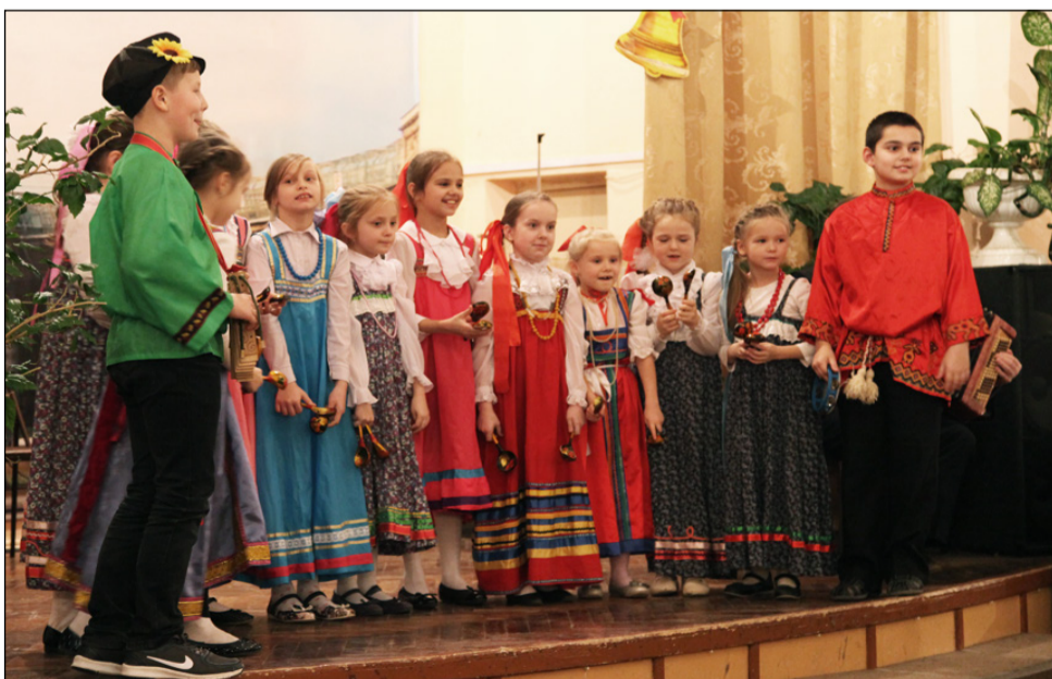
На фото: ученики школы №356 поздравляют присутствующих на празднике с юбилеем школы.

учитель русского языка и литературы, заслуженный учитель Р.Ф., участник праздничного юбилея, выпускница школы № 356.