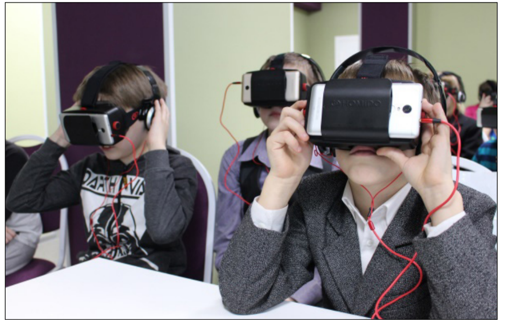
На фото: урок истории BOB в ЦДЮТТ.

Мне очень понравилось, это был интересный опыт. Главное, что живя в современном мире, мы можем погрузиться в то уже далекое прошлое, ощутить все эмоции и обстановку. Ни один фильм не даст тебе таких эмоций как виртуальная реальность, где ты чувствуешь себя не наблюдателем, а участником событий. Единственным минусом является нечеткость картинки и сложность при настраивании оборудования.