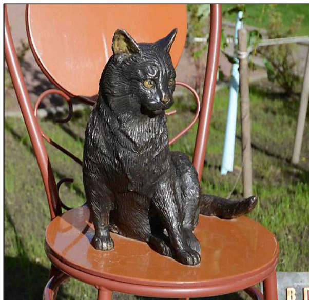
На фото: памятник кошкам блокадного Ленинграда. г. Санкт-Петербург, ул. Композиторов, д. 4.

«Моя бабушка всегда говорила, что тяжёлую блокаду и голод и я моя мама, а я её дочь, пережила только благодаря нашему коту Ваське. Если бы не этот рыжий хулиган, мы с дочерью умерли бы с голоду как многие другие.