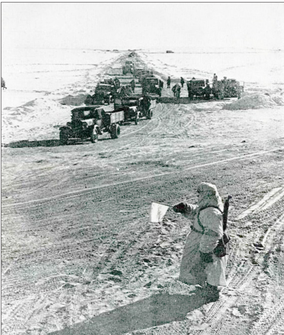
На фото: регулировщик на Ладоге - Дороге Жизни.

24.01.2017 года в Библиотеке «Музей книги Блокадного города» состоялось заседание районного штаба ЮИД, посвященное Дню снятия блокады Ленинграда. На мероприятии побывали юные корреспонденты газеты «Будни»