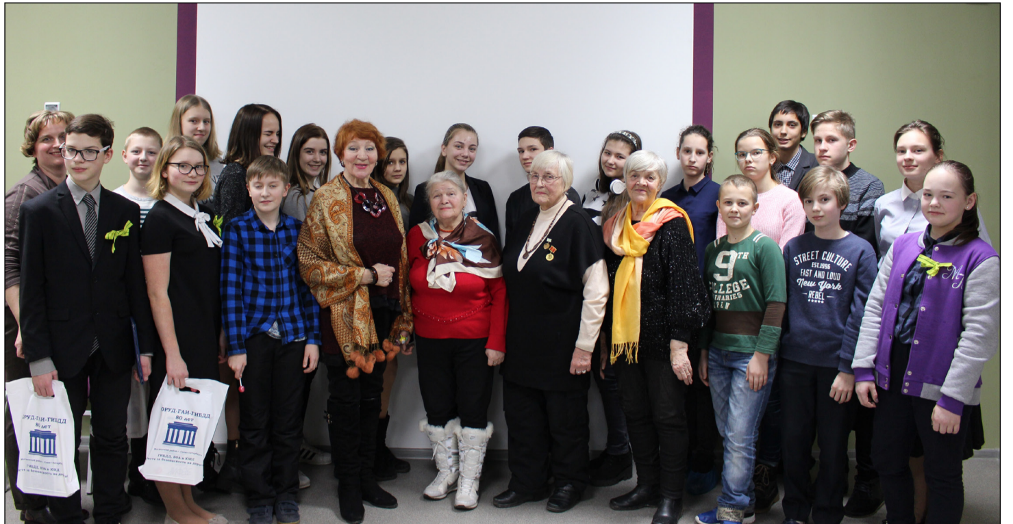
На фото: участники встречи, посвящённой Дню снятия Блокады, которая прошла в ЦДЮТТ 25.01.2017.