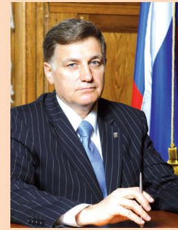
Уважаемые ленинградцы-петербуржцы! Дорогие ветераны, жители блокадного Ленинграда!

27 января – священная дата для Ленинграда, для каждой ленинградской-петербургской семьи. 74 года назад наш город полностью освободили от фашистской блокады. Сотни тысяч наших соотечественников отдали свои жизни, защищая город от врага. Оборона Ленинграда навеки вписана золотыми буквами в историю Великой Победы.