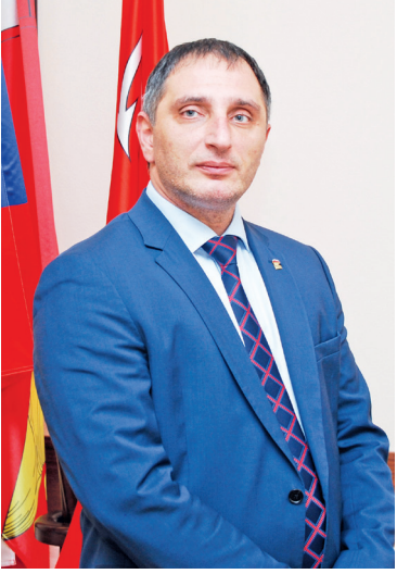
Уважаемые жители округа Звёздное! Дорогие ветераны!

Ровно 75 лет назад, 18 января 1943 года, в ходе операции «Искра» наши войска прорвали блокаду Ленинграда. Это был пере-