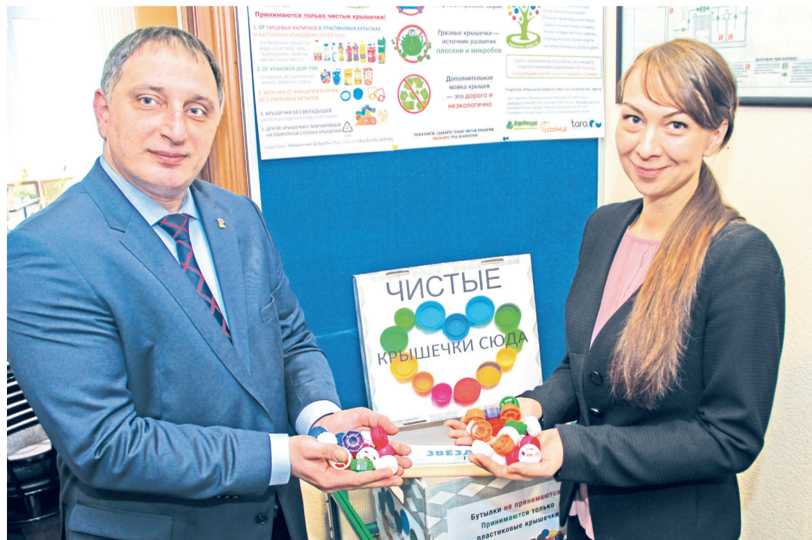
В МО Звёздное на Алтайской, 13, открыт постоянный пункт сбора пластиковых крышечек. Часы работы пункта: по будням с 10:00 до 17:00 (обед с 13:00 до 14:00). Принимаются только чистые крышечки!

В Санкт-Петербурге средства от сбора и переработки крышечек поступают подопечным благотворительного фонда «Солнце». Когда проект только стартовал, первая не-