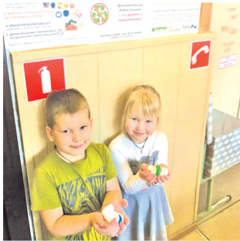
Пункт сбора крышечек в детском садике №31 на Ленсовета, 82