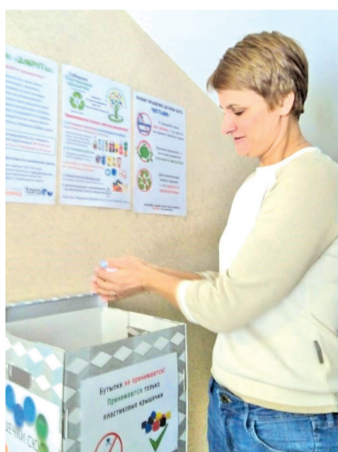
Пункт сбора крышечек в детском садике №36 на Пулковской ул., 8, корп.5, и Звёздной ул., 9, корп.2.

В Санкт-Петербурге средства от сбора и переработки крышечек поступают подопечным благотворительного фонда «Солнце». Когда проект только стартовал, первая не-