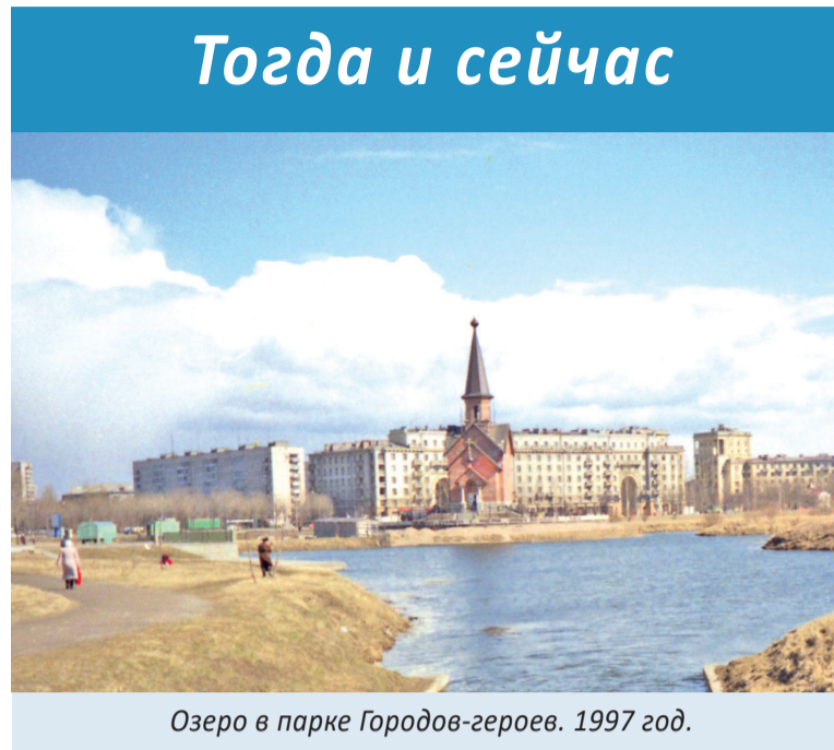
Озеро в парке Городов-героев. 1997 год.

В 2015 году в день рождения Санкт-Петербурга, в рамках XIII фестиваля «Почётные граждане Санкт-Петербурга» в парке прошла торжественная церемония закладки «капсулы времени». С каким посланием к потомкам обратились жители города, мы сможем узнать лишь в 2045 году – в 100-летний юбилей победы советского народа в Великой Отечественной войне.