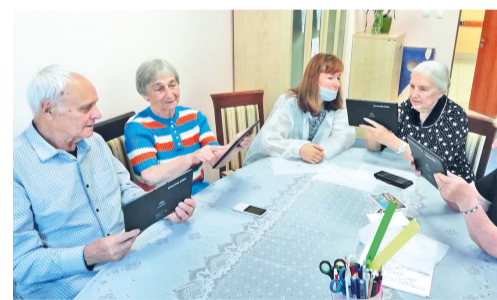
Занятия по компьютерной грамотности на отделении временного проживания снова проходят в очном формате

Сейчас все курсы проходят по предварительной записи, но многие клиенты до сих пор занимаются дистанционно. На сегодняшний день в Клубе «60+» работают академия красоты, театральная студия, литера-