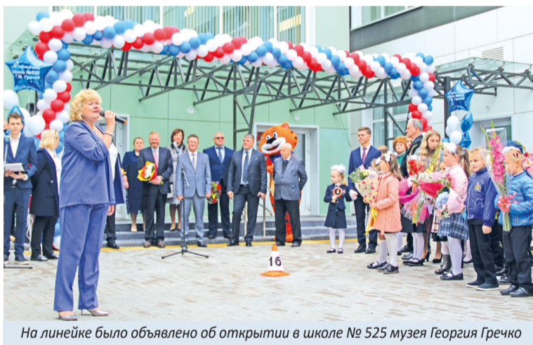
На линейке было объявлено об открытии в школе № 525 музея Георгия Гречко