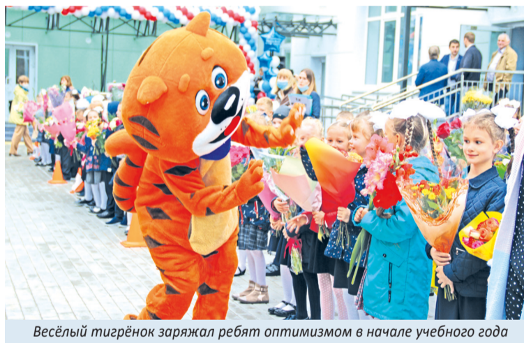
Весёлый тигрёнок заряжал ребят оптимизмом в начале учебного года