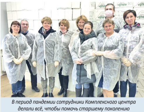
В период пандемии сотрудники Комплексного центра делали всё, чтобы помочь старшему поколению

– Во время пандемии поддержка людей со стороны сотрудников была постоянной. Если человеку что-то требовалось, то мы шли и помогали. В беде не оставляли никого, выслушивали каждого. Поэтому пожилое поколение не чувствовало себя брошенным.