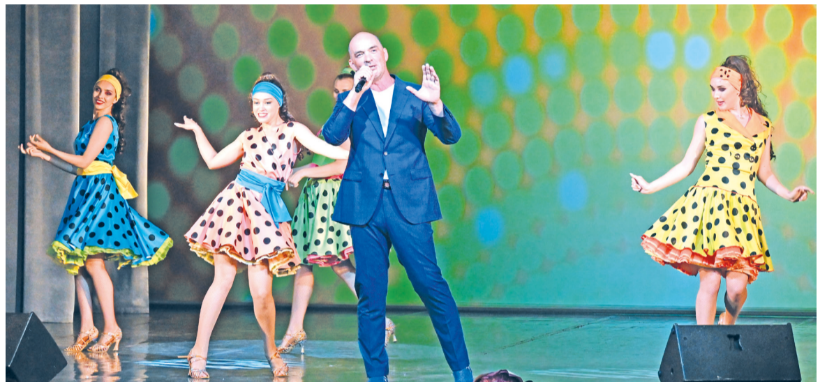
Оперный певец Методие Бужор вдохновил зрителей спеть любимые хиты вместе с ним

День России – праздник особый для каждого из нас. Это праздник нашего единения во имя процветания Родины и нашей свободы. Желаю вам здоровья и мира в семье!