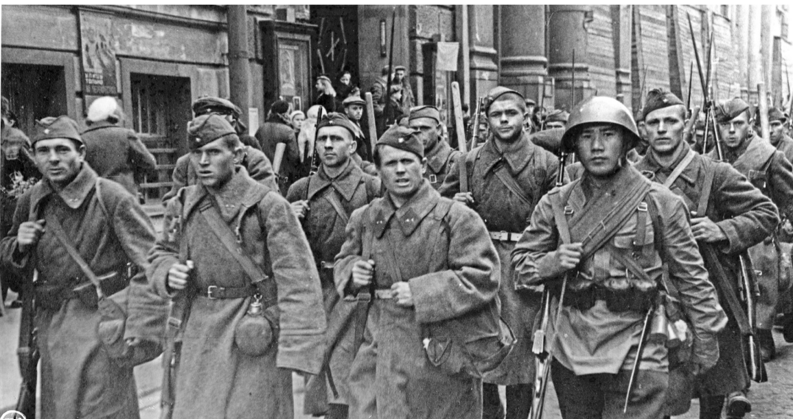
Ленинград в начале Великой Отечественной войны.