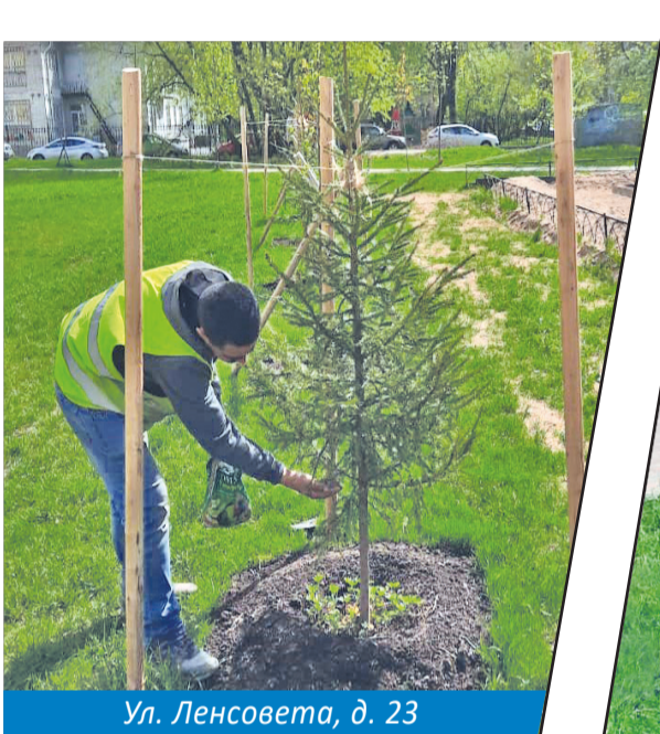
Ул. Ленсовета, д. 23