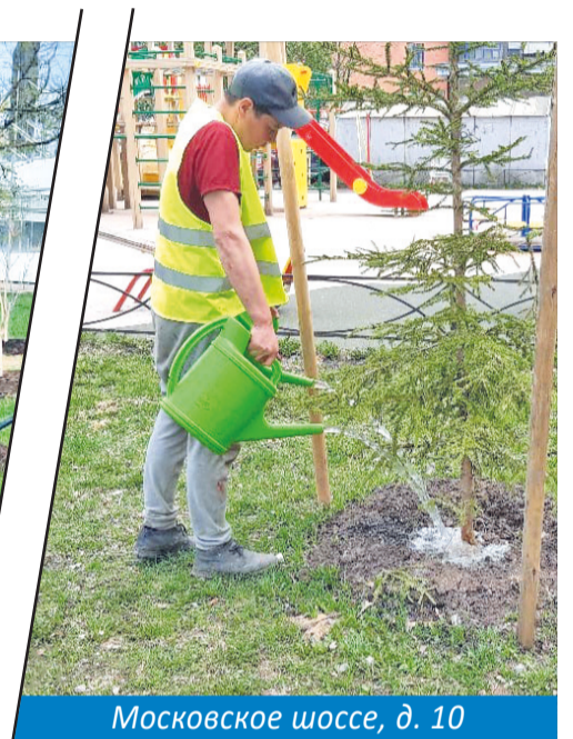
Московское шоссе, д. 10