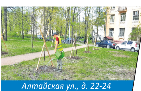
Алтайская ул., д. 22-24