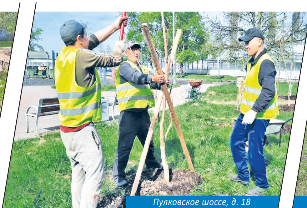
Пулковское шоссе, д. 18