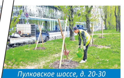
Пулковское шоссе, д. 20-30