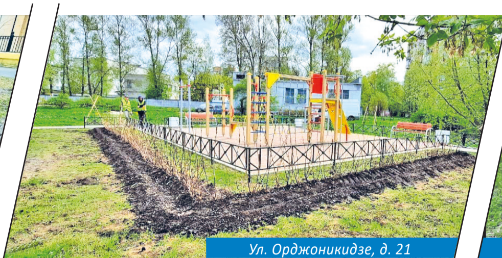
Ул. Орджоникидзе, д. 21