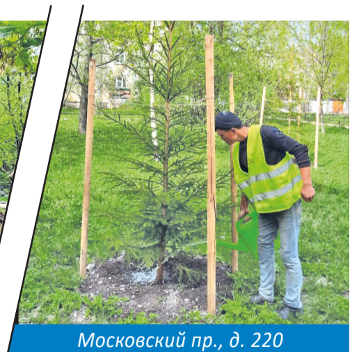
Московский пр., д. 220