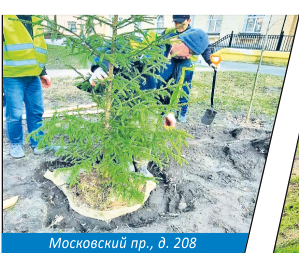
Московский пр., д. 208