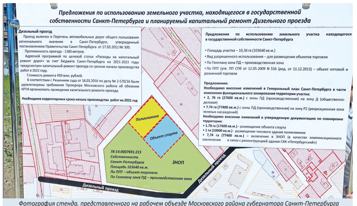
Фотография стенда, представленного на рабочем объезде Московского района губернатора Санкт-Петербурга

Хочется поблагодарить губернатора Александра Беглова за внимание, которое он уделяет нашему муниципальному округу, и за принятые им решения по выделению средств на развитие нового микрорайона. И, конечно, огромная благодарность неравнодушным жителям, которые обращают внимание властей на существующие проблемы.