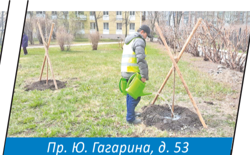
Пр. Ю. Гагарина, д. 53