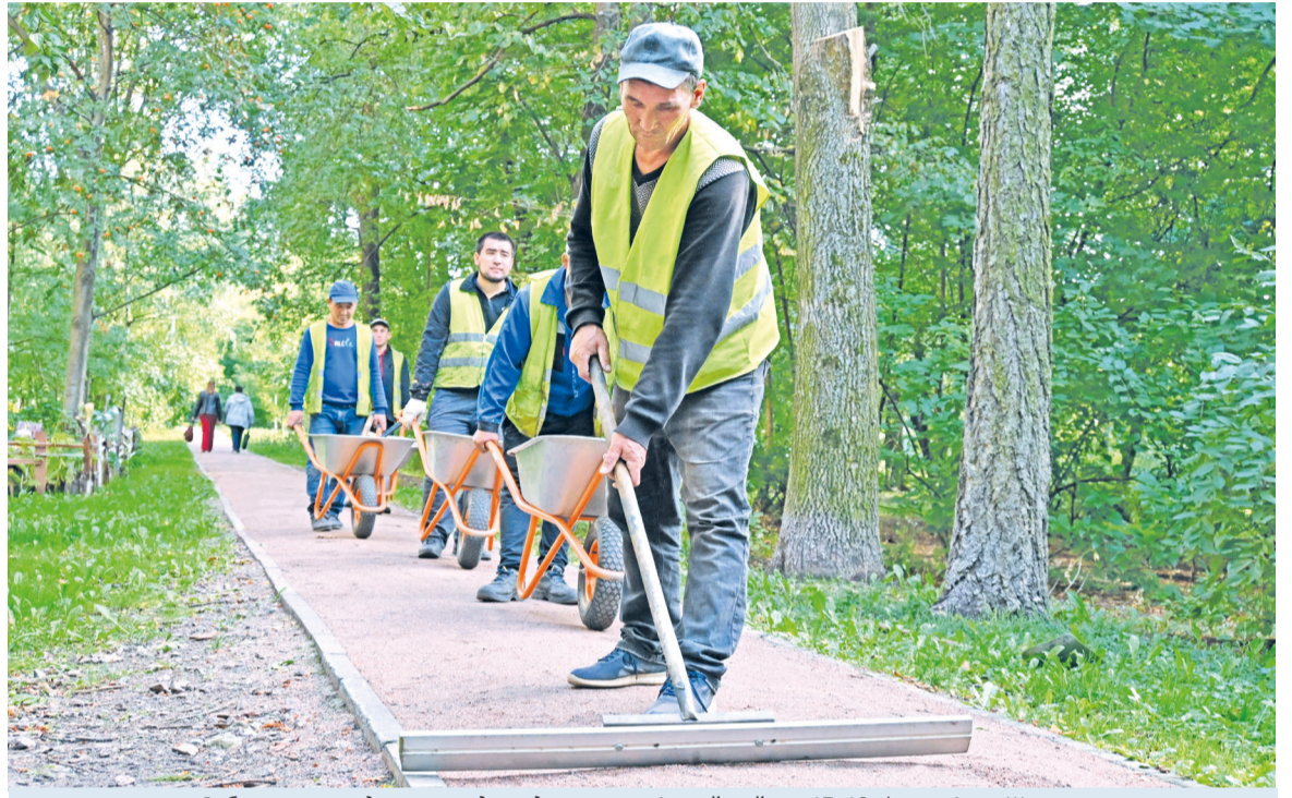
Работы по укладке пешеходных дорожек на Алтайской ул., 17–19.

Как видите, процесс этот не быстрый. Мы искренне благодарны активным жителям округа, которые сообщают о существующих в округе проблемах. Пожалуйста, не стесняйтесь обращаться со своими предложениями! Если вопрос не укладывается в рамки одного заявления, приглашаю вас на личный приём. Каждую среду с 11:00 до 13:00 двери моего кабинета открыты для вас!