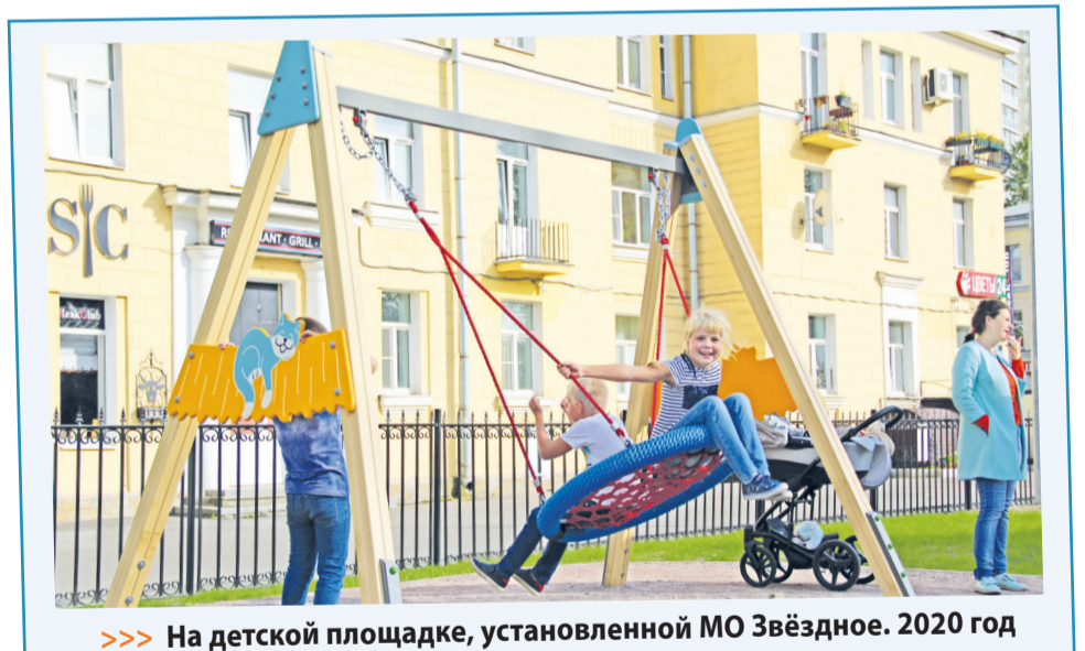
>>> На детской площадке, установленной МО Звёздное. 2020 год