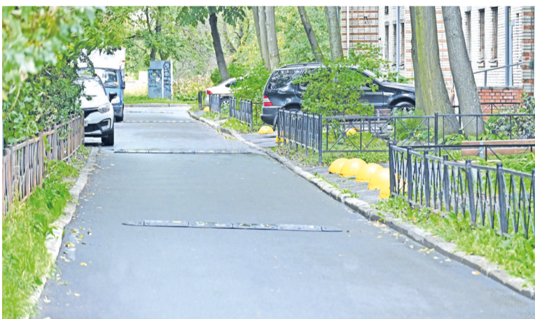
Асфальтирование на ул. Орджоникидзе, 31, корп. 1.

Площадь запланированных работ составляет больше 2500 кв. м набивного покрытия.