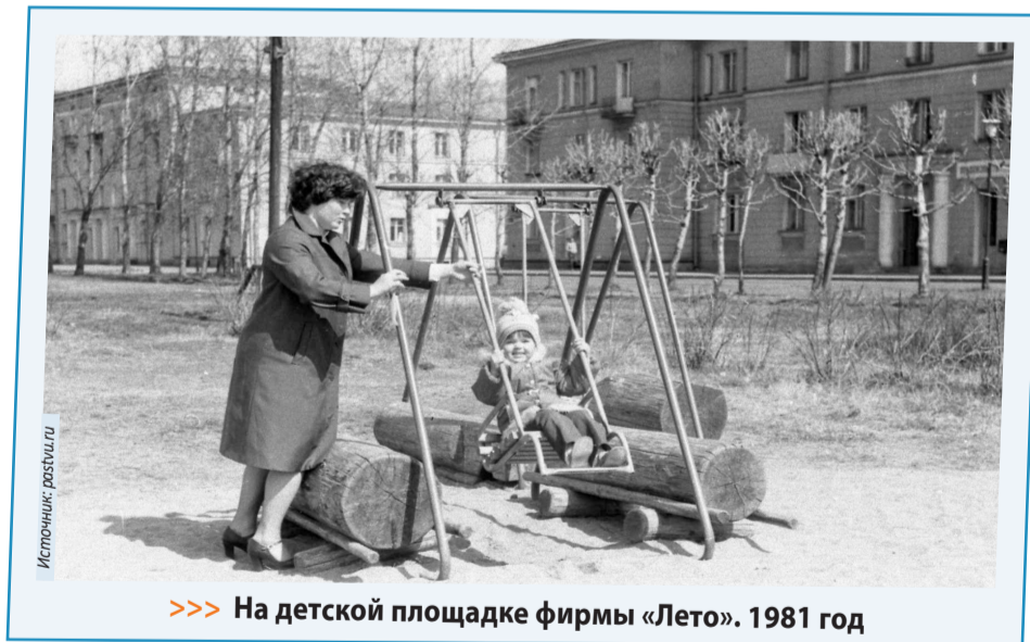
>>> На детской площадке фирмы «Лето». 1981 год