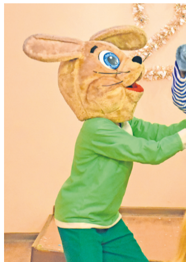
Перед зрителями выступали и знакомые герои любимых мультфильмов, и клоун Фунтик с фокусами и зверями