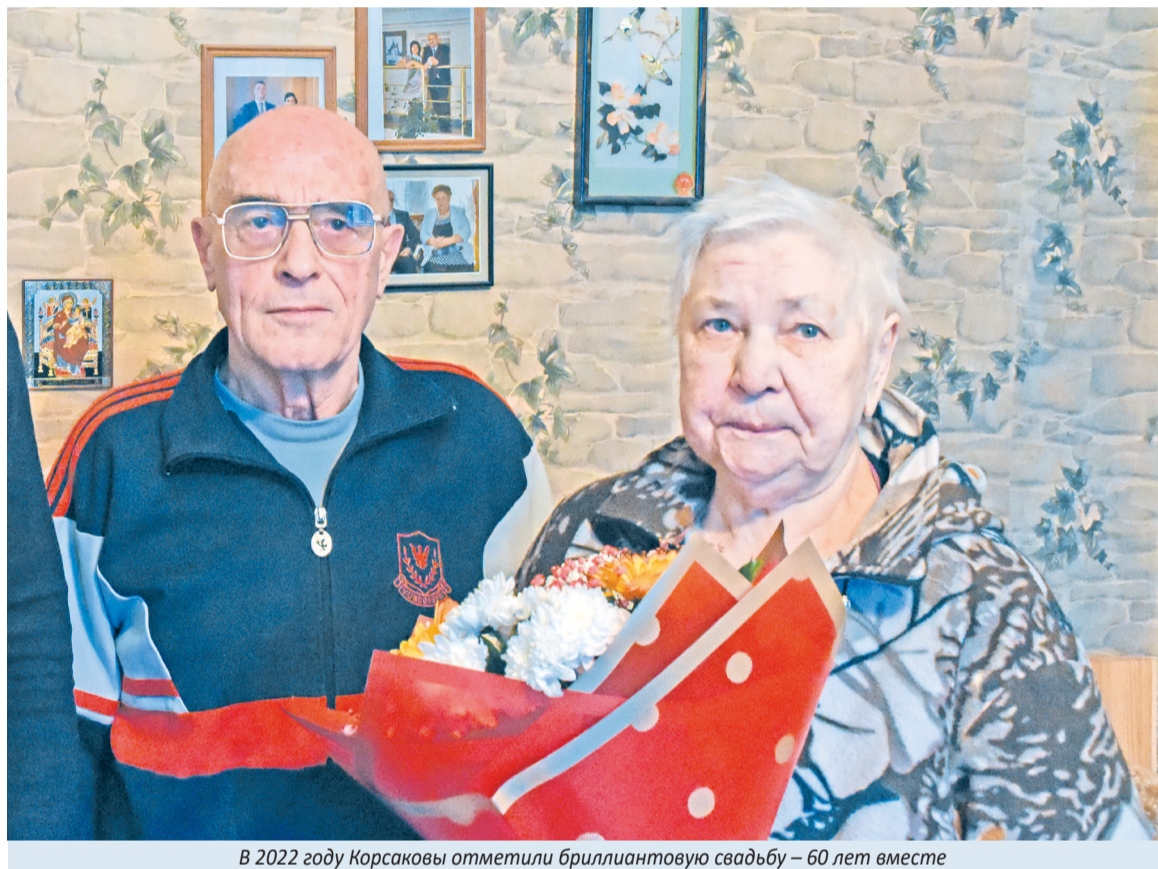
В 2022 году Корсаковы отметили бриллиантовую свадьбу – 60 лет вместе

Так вышло, что оба супруга родились в Ленинграде и пере-