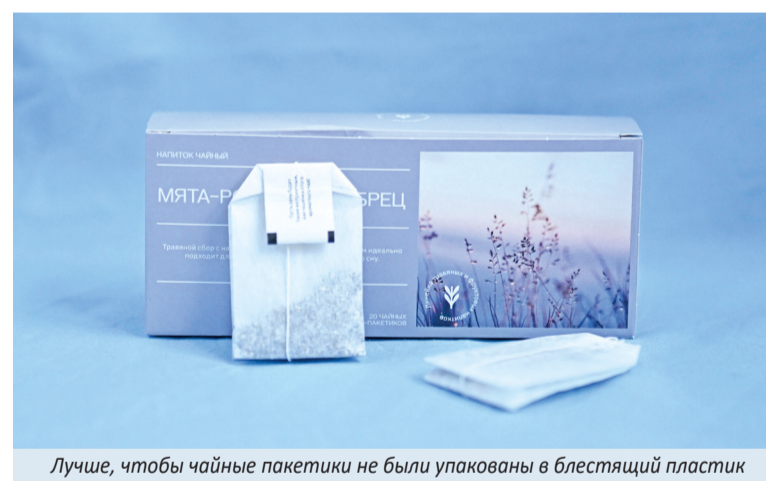
Лучше, чтобы чайные пакетики не были упакованы в блестящий пластик