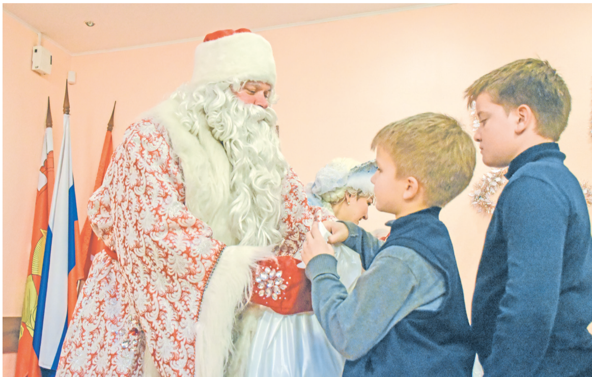
Дед Мороз и Снегурочка вручили подарок каждому гостю на праздничной ёлке

Цирковая атмосфера продолжается в выступлениях клоуна Фунтика. Он поистине стал гвоздём программы: на потеху публике показал три уникальных номера. В первом из них Фунтик мастерски раскручивает разноцветные тазы и удерживает их на кончике шеста, а затем приглашает юных зрителей присоединиться к выступлению и удержать вращающиеся тазы в равновесии.