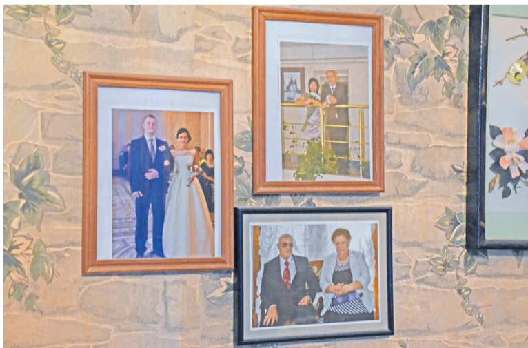
Семейные фотографии самых важных торжеств развешаны на стенах дома

«Самое главное, чтобы люди не обижали друг друга. Чтобы в семье не приходила беда. Чтобы детей растили, не бросали. И тогда будет в доме счастье!»