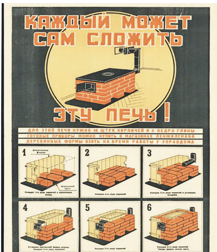
В 1942 году в Ленинграде печатали плакаты с подробной инструкцией по самостоятельной сборке кирпичной печи-времянки