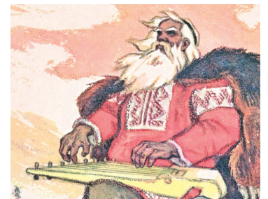
Главный герой «Калевалы» Вяйнёмейнен

По информации Дома Национальностей Санкт-Петербурга