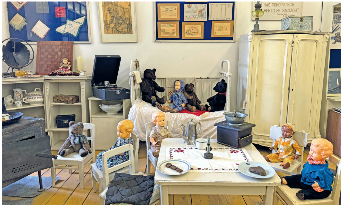
Часть экспозиции музея «Дети и воспитатели осаждённого Ленинграда»

Машинист метался то назад, то вперёд, меняя скорость, чтобы не быть в одной точке. Вдруг очень близко от нас разорвался снаряд, и самый большущий осколок залетел в вагон. А у меня над головой на гвоздике висела моя кофточка. И этот снаряд пролетел прямо через неё – из нас ранение получила именно кофта. А мы живыми приехали в Ленинград и ещё долго хранили эту кофточку.