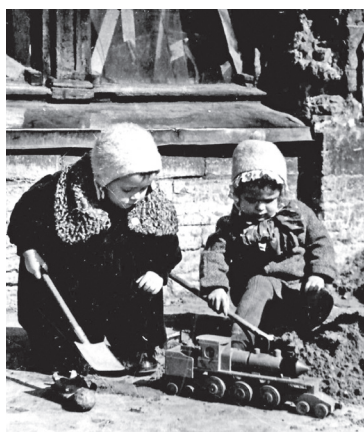
■ Воспитанники детского сада № 18 на прогулке, апрель 1942 г.

До нас они ещё как-то добрались, нашли нас где-то под кустами и притащили на станцию. А вернуться обратно оказалось