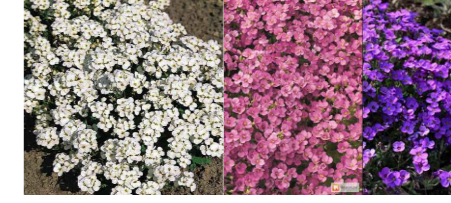
Арабис Клен остролиственный