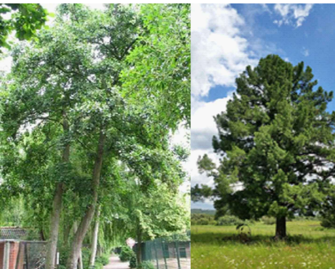
Сосна сибирская кедровая.